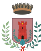
Comune di Poggio Mirteto